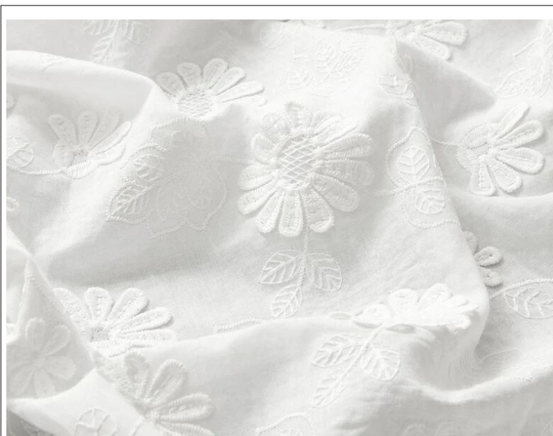
Figura 12: Espumilla

En la actualidad, la Santísima Virgen de las Angustias no cuenta con ninguna toca en su ajuar, por lo que la tradición de vestir a la Sagrada imagen con esta prenda no se mantiene en nuestros días.