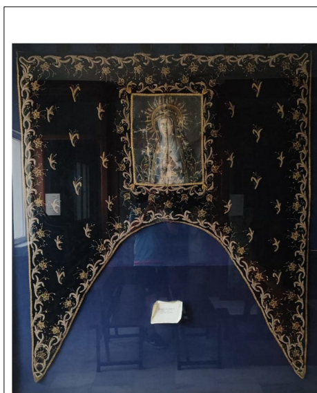
Figura 6: Antiguo estandarte.

En este momento, la tradición de los estandartes se mantiene viva en la hermandad, que porta uno por cada paso en su Estación de Penitencia: uno para el Santísimo Cristo de la Columna, otro abriendo el tramo del Santo Sepulcro y, finalmente, el de la Santísima Virgen, que encabeza el tramo de nazarenos de la Patrona en la Estación de Penitencia. Indagando más, en la zona del museo de la ermita se conserva enmarcado un estandarte con la imagen de la Santísima Virgen, del cual se desconocen tanto su autor como la fecha de su confección. Históricamente, las estrellas bordadas en oro o plata se asocian a la imagen de la Virgen, y hoy las encontramos en los mantos que posee la venerada imagen.