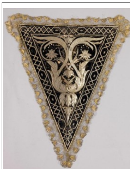
Figura 10: Pecherín