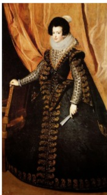
La reina Isabel de Borbón, por Diego Velázquez. (1625).

La basquiña es un tipo de falda o saya que se usó en España por mujeres en ceremonias, actos religiosos y para salir a la calle desde el siglo XVI al XIX. Se caracteriza por numerosos pliegues en la cintura que generan un vuelo abultado en la parte inferior; originalmente, se colocaba sobre los guardapiés y solía ser de color negro. En la actualidad, algunas de las sayas de la Santísima Virgen conservan estos pliegues, aunque con un vuelo inferior. Es notable que el candelero, sustituido en la última restauración de la Virgen, mantenía dichos pliegues.