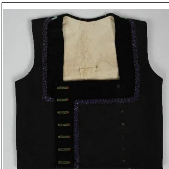
Figura 11: Armilla

En la actualidad, la Virgen, dentro del ajuar que atesora, posee diversos "pecherines", los cuales podrían constituir la evolución de aquella antigua vestidura. El "pecherín" contemporáneo se complementa con las mangas ricamente bordadas que engalanan la Sagrada Imagen.