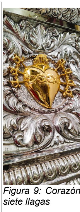
Figura 9: Corazón siete llagas