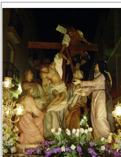
Figura 3: Descendimiento adquirido a mediados del S. XX

Muy Antigua, Ilustre, Venerable y Patronal Hermandad de Ntra. Sra. La Santísima Virgen de las Angustias