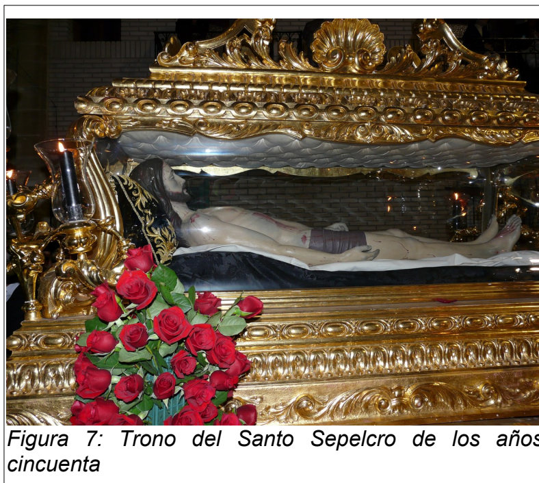
Figura 7: Trono del Santo Sepulcro de los años cincuenta

Una característica distintiva del Santo Sepulcro de Vera es el dorado de su talla, algo poco común en este tipo de pasos, y que ya este inventario refleja. Actualmente, se ha realizado una nueva talla del trono del Santo Sepulcro para reemplazar la realizada en Madrid en los años cincuenta. La talla completa del trono ha finalizado y se está a la espera de su dorado.