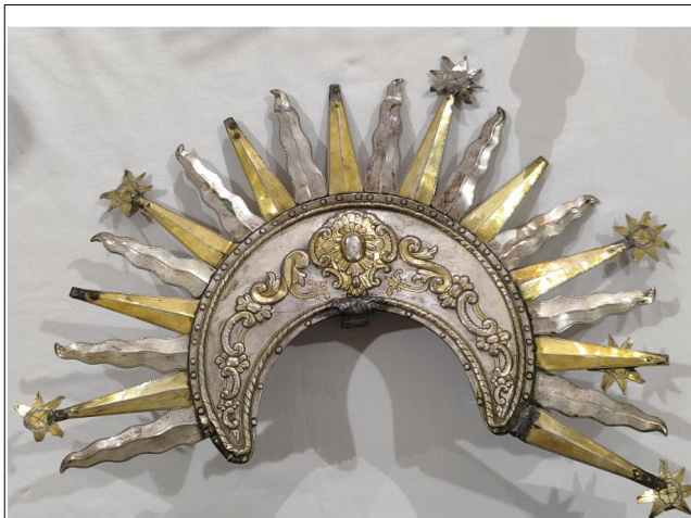
Figura 14: Diadema que se conserva en el Museo de la Hermandad

Muy Antigua, Ilustre, Venerable y Patronal Hermandad de Ntra. Sra. La Santísima Virgen de las Angustias