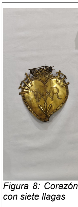
Figura 8: Corazón con siete llagas