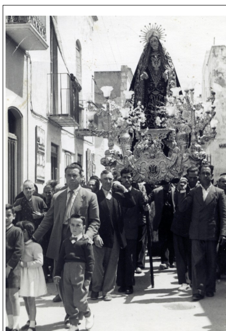
Figura 2: Andas de mediados del S. XX

Por lo tanto, la existencia de dos andas puede deberse al deterioro de una de ellas. Esta necesidad de preservar adecuadamente los enseres de la hermandad se evidencia en Juntas de Gobierno posteriores donde se aborda la adquisición de una vivienda para su correcto almacenamiento.