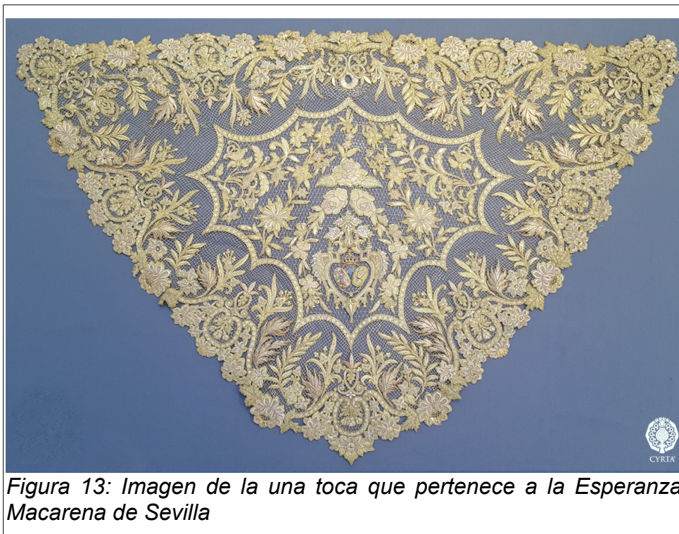
Figura 13: Imagen de la una toca que pertenece a la Esperanza Macarena de Sevilla

Muy Antigua, Ilustre, Venerable y Patronal Hermandad de Ntra. Sra. La Santísima Virgen de las Angustias