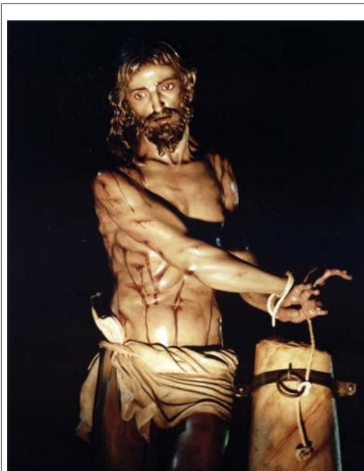
Figura 4: Stm. Cristo de la Columna . Autor: D. Juan Manuel Miñarro López

Muy Antigua, Ilustre, Venerable y Patronal Hermandad de Ntra. Sra. La Santísima Virgen de las Angustias