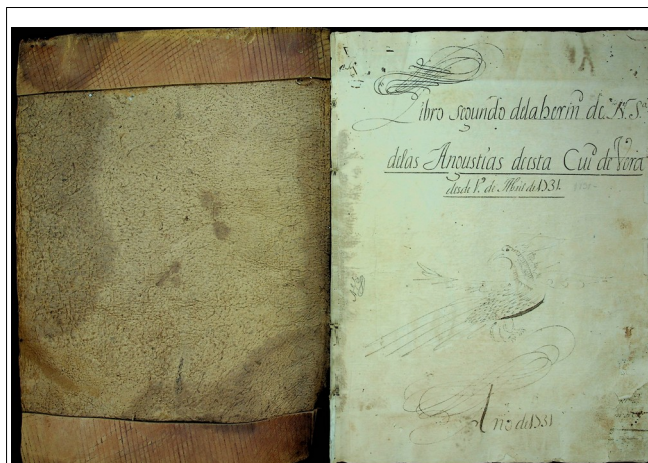
Figura 5: Libro 2º. A.P. VERA

Se trata del Libro 2º de la Hermandad que se encuentra en el Archivo Parroquial de Vera que va desde el año 1731 hasta el año 1749