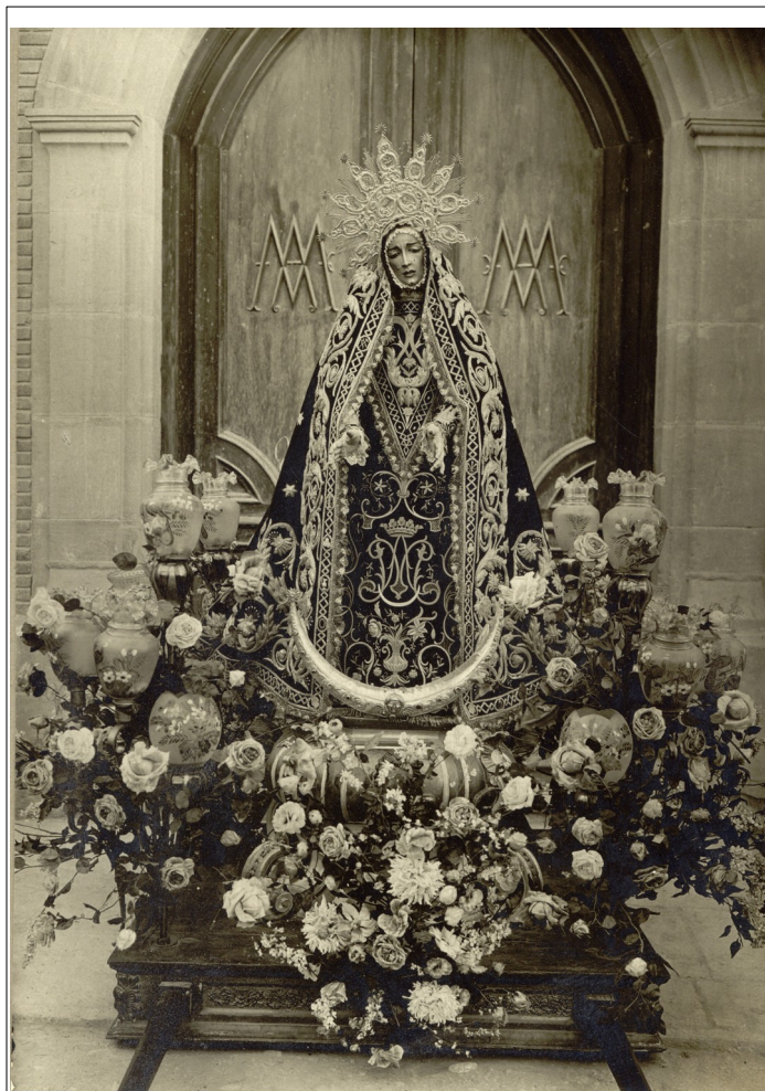
Figura 16: Imagen anterior a la Guerra Civil

Muy Antigua, Ilustre, Venerable y Patronal Hermandad de Ntra. Sra. La Santísima Virgen de las Angustias